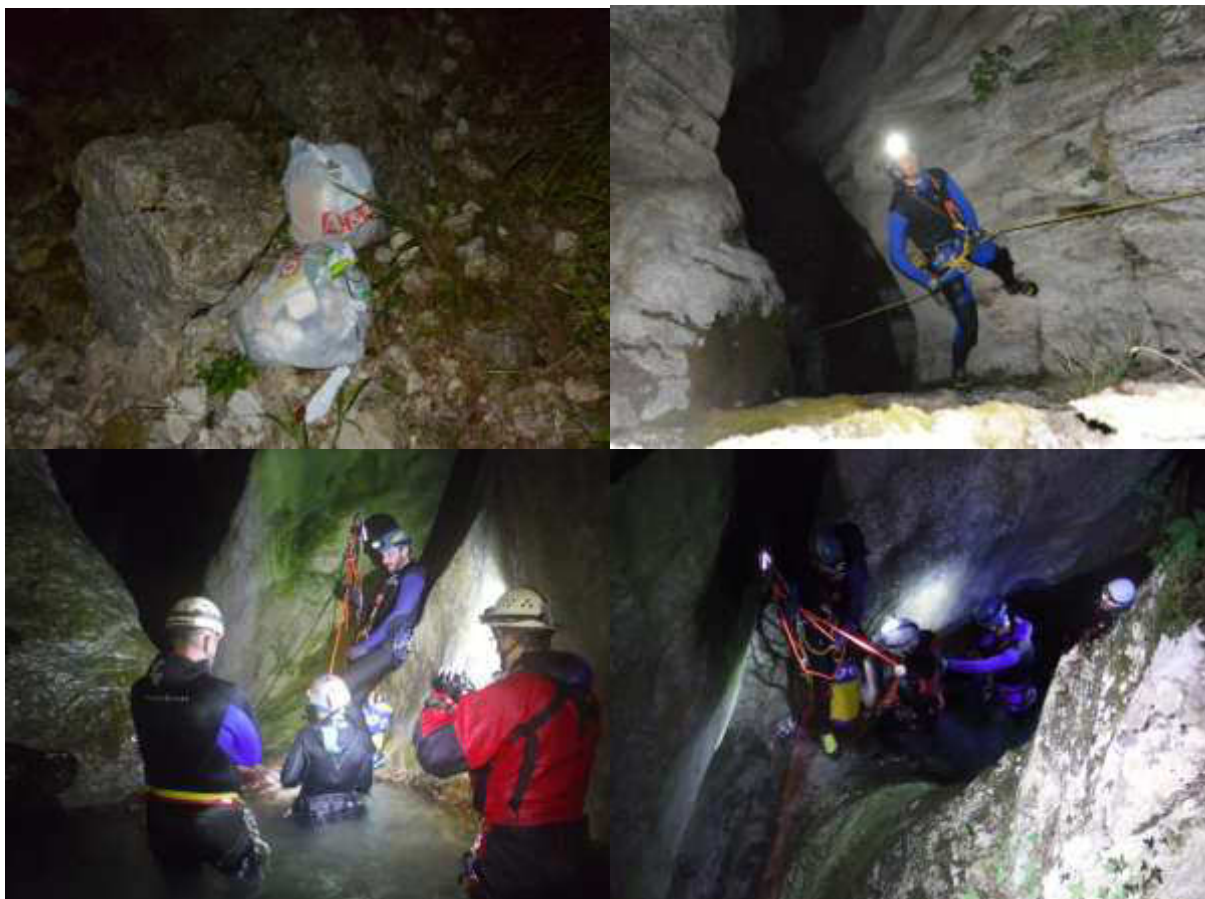
Fig. 4. Foto discesa notturna Ciafurle

Nella notte del 23 Giugno è stata organizzata la discesa notturna del Torrente Chiandola (Ciafurle) (Fig. 4). Per renderla sicura anche ai partecipanti meno esperti, tutte le calate sono state attrezzate e presidiate da torrentisti che avevano frequentato corsi SNC di 2° o 3° livello. Le calate sono state illuminate con luci chimiche (donate da Ozone Rescue, www.ozonerescue.it ) e torce frontali. Durante la discesa del Rio Ciafurle sono stati rinvenuti nell'alveo del torrente alcuni sacchetti di immondizie (Fig. 4) che sono stati prontamente rimossi e smaltiti. Il problema è già noto al Comune di Claut e al Parco delle Dolomiti Friulane, ma è stato comunque nuovamente segnalato. La serata si è conclusa con un momento conviviale.