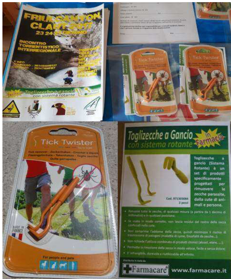
Fig. 2. Toglie zecche omaggio della ditta Farmacare

La zona montana e pedemontana del Friuli Venezia Giulia è largamente popolata da zecche, specialmente nel periodo che va dalla primavera all'autunno con un picco massimo in giugno. Questi parassiti possono trasmettere diversi agenti infettivi responsabili di malattie anche complesse quali la Borrelia e del virus della meningoencefalite. La probabilità di contrarre un'infezione è direttamente proporzionale alla durata di permanenza del parassita sull'ospite è quindi importantissimo disporre di un togli zecche efficiente per ridurre questo rischio. A tale proposito e date queste premesse, gli incaricati dell'organizzazione di "FriulCanyon" hanno contattato la ditta farmaceutica Farmacare ( www.farmacare.it ) la quale ha fornito gratuitamente 50 kit togli zecche e del materiale informativo per l'utilizzo di tali strumenti. L'organizzazione ha riscontrato un feedback positivo da parte degli iscritti al raduno che hanno usufruito di questo gadget, omaggio della Farmacare (Fig. 2). Tale ditta è interessata a sponsorizzare anche il raduno internazionale a Delebio.