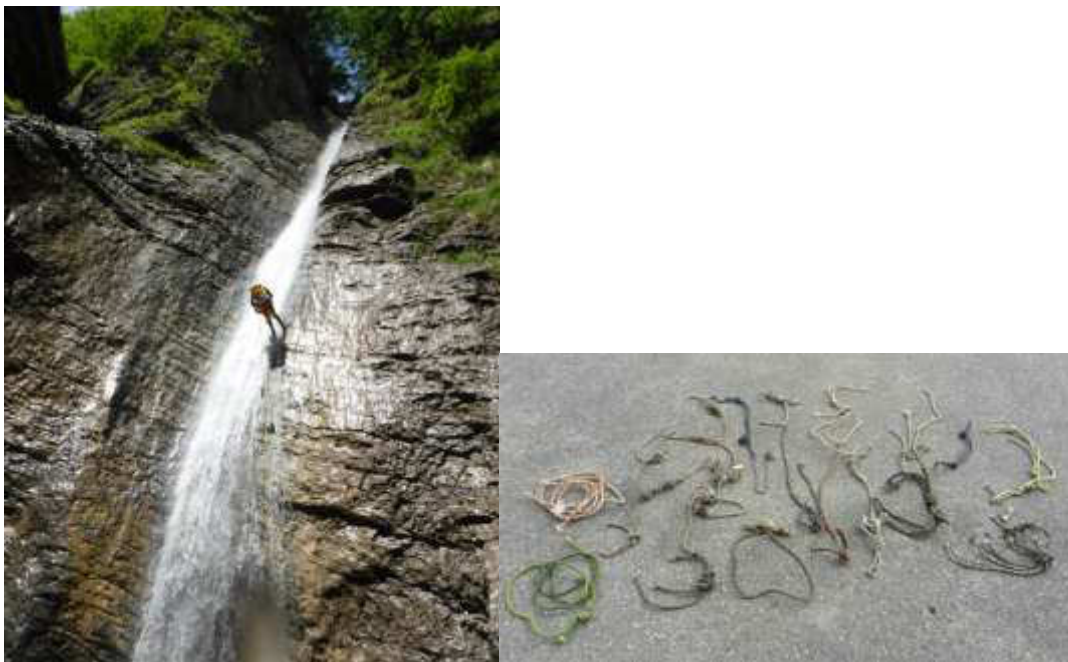
Fig. 3. Foto della discesa e i cordini cambiati nel Rio Ciorosolin.

Durante la discesa di questi itinerari alcuni partecipanti al raduno hanno provveduto a ripristinare vari ancoraggi e sostituire i cordami ormai vecchi per rendere più sicura l'attività (Fig. 3).